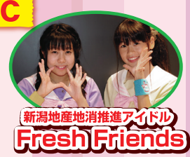
新潟地産地消推進アイドル Fresh Friends